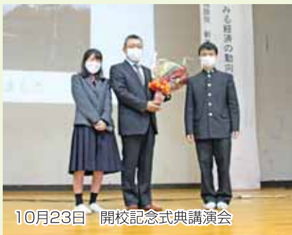
10月23日 開校記念式典講演会