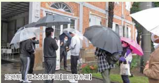
定時制 郷土体験学習【富岡製糸場】