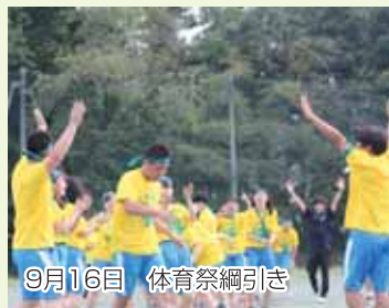
9月16日 体育祭綱引き