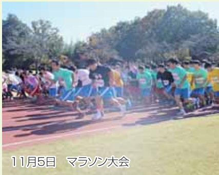
11月5日 マラソン大会