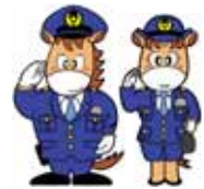
上州くん みやまちゃん

犯人は、電話をかける際に、個人情報が掲載されている名簿を使用している可能性がありますので、同窓生名簿などの取り扱いには十分注意してください。