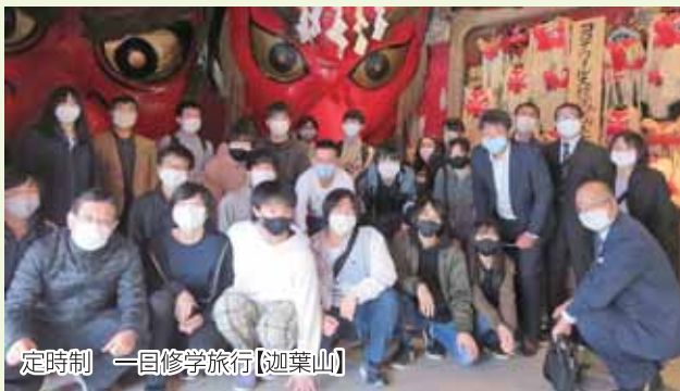
定時制 一日修学旅行【迦葉山】

沼田市の原田農園でリンゴ狩り、アイスクリームづくりを行い、びどろパークでマガカップの絵付けを体験しました。県内の修学旅行になりましたが、思い出に残る、楽しい一日になりました。