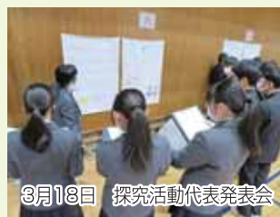
3月18日 探究活動代表発表会