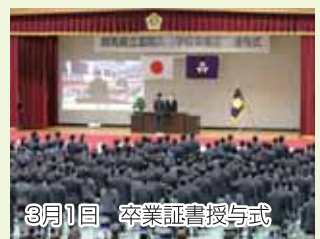
3月1日 卒業証書授与式