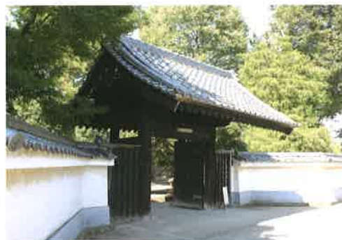
富岡高校は上州前田家の七日市藩邸跡地にあります。「黒門」は藩邸の中門として使われたもので、本校のシンボリック的存在です。