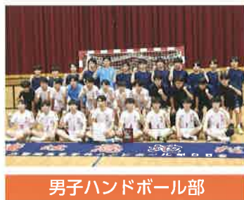
男子ハンドボール部