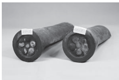
◆七日市陣屋巴瓦(群馬県立富岡高等学校蔵)