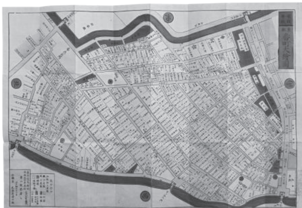
◆東都割絵図(金沢市立玉川図書館近世史料館蔵)

令和7年10月2日、金沢市と富岡市の間に友好都市協定が結ばれ、江戸時代から続く両市の交流は新たな段階を迎えました。本展を通じて、加賀藩主家の親戚である七日市前田家について、そして金沢・富岡の交流の歴史について知っていただければ幸いです。